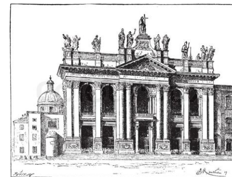
Bazylika św. Jana na Lateranie

Bóg jest w jego wnętrzu, więc się nie zachwieje, Bóg je wspomaga o światło. Pan Zastępów jest z nami, Bóg Jakuba jest naszą obroną. Przyjdźcie, zobaczcie dzieła Pana, zdumiewające dzieła, których dokonał na ziemi.